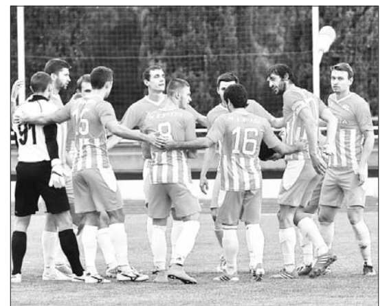
Сторінку підготував Андрій Яцик.

Крім того, команда не має коштів навіть на харчування і третій день поспіль їсть по вісім маленьких пельменів. На завершення Жигайлов зазначив, що коли він з футболістами приїжджав до Ялти, то сподівався, що там хоч хтось любить футбол, а тепер невідомо, чи команда існуватиме далі.